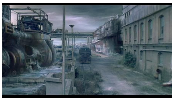
Enki Bilal – Bunker Palace Hôtel (1989)